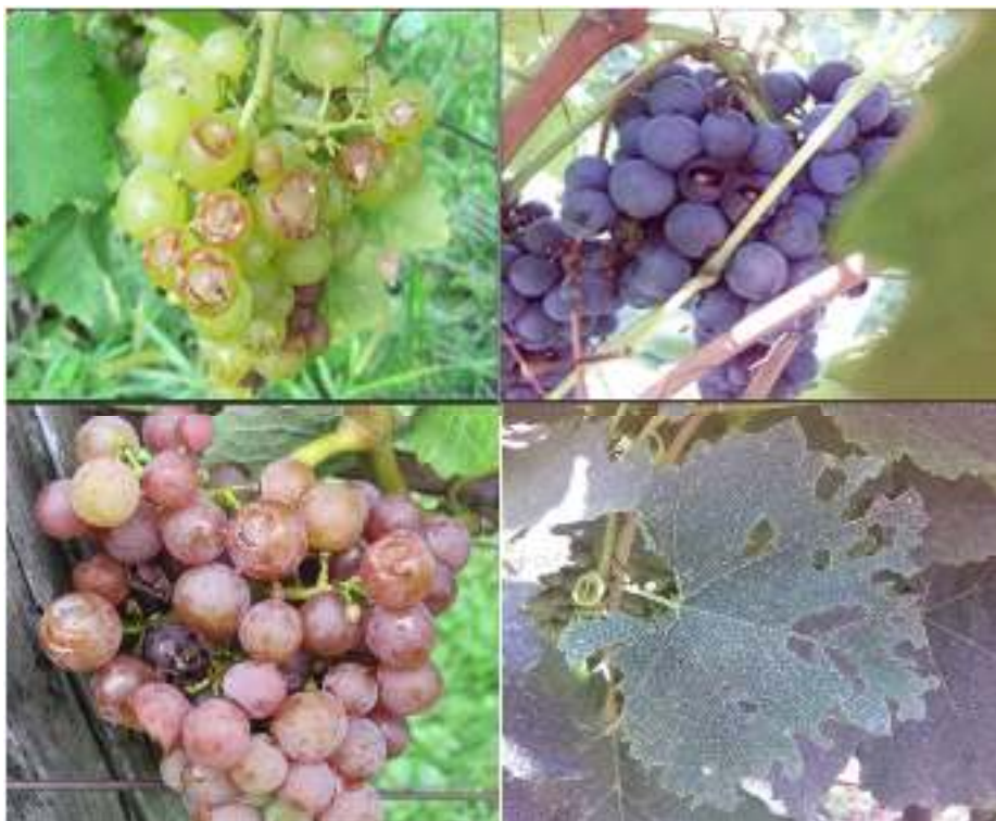
Slike 4 do 7: Poškodbe na grozdju sort ‚Rumeni muškat‘, ‚Modra frankinja‘ in ‚Rdeča žlahtnina‘. Gosenice južne plodovrtke ( Helicoverpa armigera ) se sprva hranijo na povrhnjici groznih jagod. Občasno smo na napadenih trsih zasledili tudi obgrizene liste, a hranjenja gosenic na njih nismo opazili.

Pri lovu odraslih metuljev z avtomatiziranimi feromonskimi pastmi smo v letih 2017 in 2018 beležili redne in dokaj množične ulove na izraziti vinogradniški lokaciji, medtem ko je pojavljanje na vrtnarskem pridelovalnem območju manj izrazito.