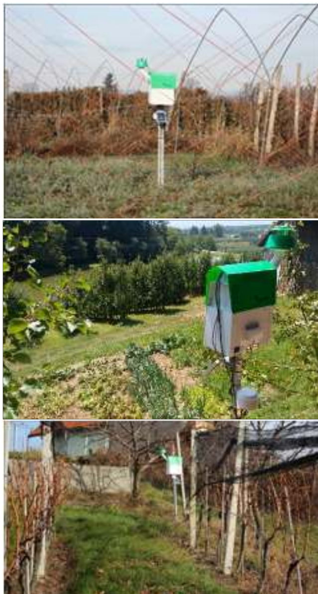
Slike 1 do 3: Avtomatske pasti Trapview smo namestili na ravninski vrtnarski legi ob reki Krki (Cerklje ob Krki; 214 m n.v.), na sadjarski legi z bližnjim zelenjavnim vrtom (Okljukova Gora; 214 m n.v.) in vinogradniški legi (Zgornja Pohanca; 361 m n.v.).