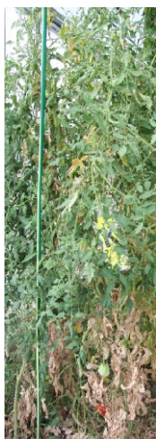
Slika 1: Neškropljeno obravnavanje.

V poskusu smo spremljali številčnost pršic (nimfe in odrasle pršice) na izrezanih delih stebela dolžine 20 mm in širine 8 mm. Izrezane dele stebela iz vseh obravnavanj/ponovitev smo izbirali naključno na dveh višinah; torej od tal do 120 cm in med 120 do 200 cm višine rastline. Posamezen izrezek smo nato s pomočjo stereomikroskopa Nikon SMZ-2B pregledali in prešteli število pršic. Ocena je bila opravljena v dveh terminih, in sicer 4.8. in nato še 19.8.2022. Dobljene rezultate smo statistično obdelali (ANOVA).