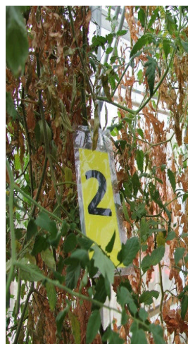
Slika 3: Drugo obravnavanje.