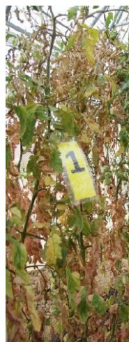
Slika 2: Prvo obravnavanje.