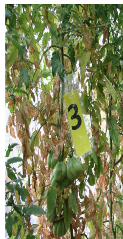
Slika 4: Tretje obravnavanje.