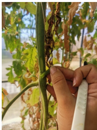
Slika 5: Izrezovanje delov stebela na različnih višinah rastline. Na izrezanih delih smo v letih 2022 in 2023 primerjali številčnost pršic po obravnavanjih.

Kot je razvidno iz preglednice, je pojav paradižnikove rjaste pršice v letu 2023 v zavarovanem prostoru nastopil nekoliko kasneje, tako da smo prvo škropljenje izvedli 26.6.2023. Podobno kot v predhodnem letu smo v dveh terminih opravili oceno številčnosti organizmov, in sicer 10.8. in 24.8.2023. Tudi tokrat smo naključno vzorčili izrezane dele stebela na različnih višinah rastline in prešteli pršice. Podatke smo ponovno obdelali s pomočjo analize variance.